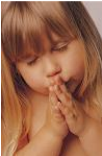
ES TIEMPO DE MULTIPLICAR LA ORACIÓN

“Clama a mí, y yo te responderé, y te enseñaré cosas grandes y ocultas que tú no conoces” (Jeremías 33:3)