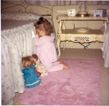
LA UNIÓN HACE LA FUERZA TODOS A ORAR

POR MI IGLESIA, PARA QUE DIOS SAQUE TODO PECADO Y ESTE SEA DESCUBIERTO Y CONFESADO PARA QUE DIOS SANE TODA INMUNDICIA Y LA IGLESIA PUEDA CRECER EN SANTIDAD HACIA EL.