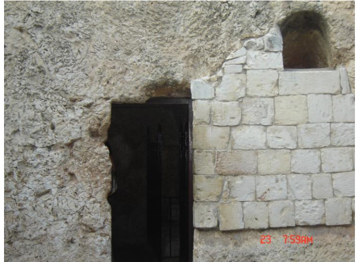
TUMBA VACÍA DE NUESTRO SEÑOR JESUCRISTO EN JERUSALÉN