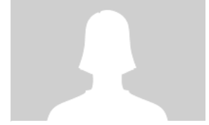
HARSA DESDE 2010