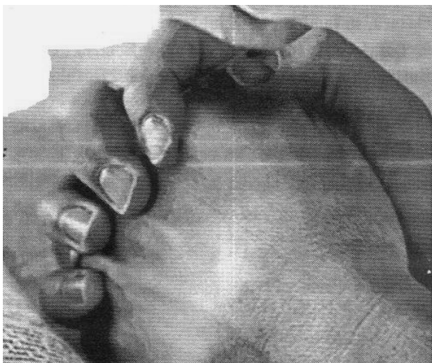
OREMOS POR LAS MISIONES DE MÉXICO

“Porque así nos ha mandado el Señor, diciendo: Te he puesto para luz de los gentiles, a fin de que seas para salvación hasta lo último de la tierra” (Hechos 13:47)