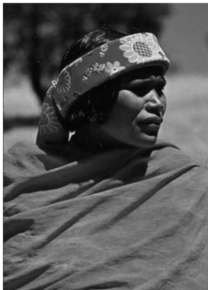
ALCANCEMOS A NUESTRAS ETNIAS PARA CRISTO

“Antes que te formase en el vientre te conocí, y antes que nacieses te santifiqué, te di por profeta a las naciones” (Jeremías 1:5)